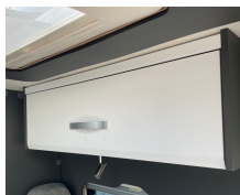
+ Trädekor Amberes Oak ○