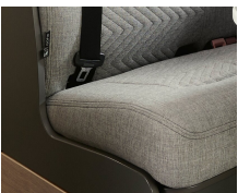
+ Klädsel Scandi ○