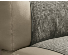
+ Klädsel Camino