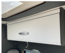
+ Trädekor Ambers Oak ○