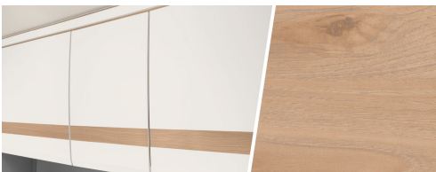
+ Trädekor Noce Nagano