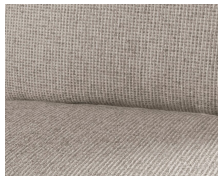
+ Klädsel Heron (textilläder) ○