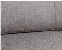
+ Klädsel Tarragona