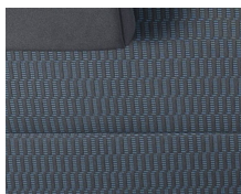
+ Sätessklädsel Cran Blue