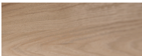
+ Trädekor Noce Nagano