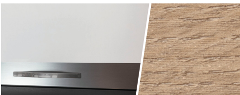
+ Trädekor Amberes Oak