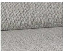
+ Klädsel Samir