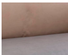
+ Klädsel Duke ○