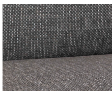
+ Klädsel Floyd