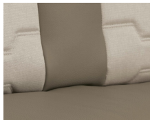
+ Klädsel Nubia ○