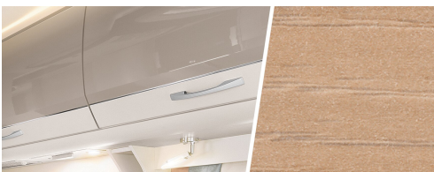
+ Trädekor Noce Nagano