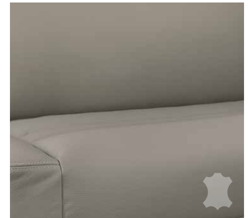
Collin (äkta läder, tillägsutrustning)