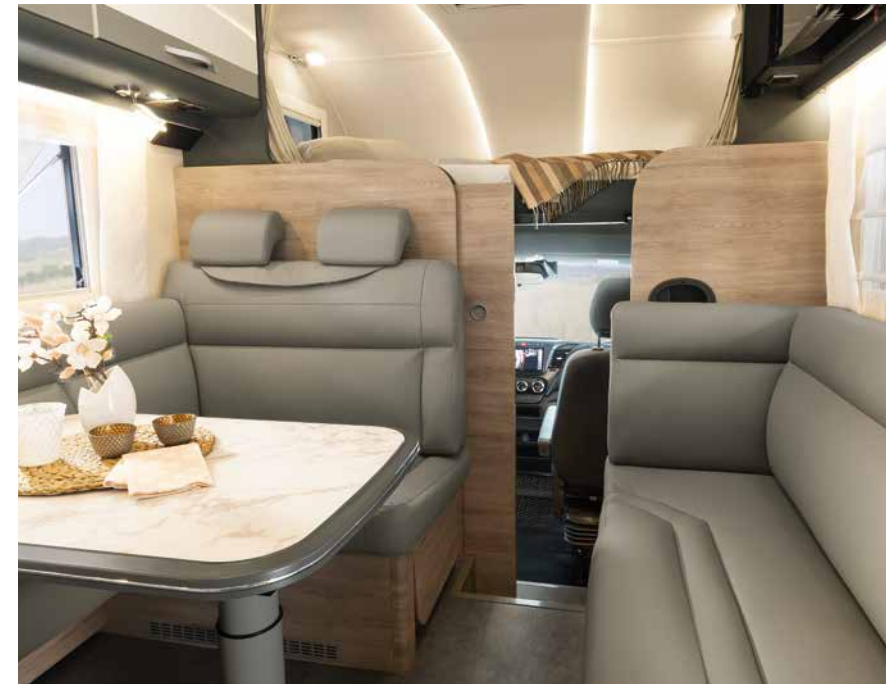
Förarhytten kan separeras från boendetrymmet med hjälp av en stabil skjutdörr av trä. Perfekt för att skydda mot kyla och hetta – samt objudna gäster, eftersom den även går att låsa