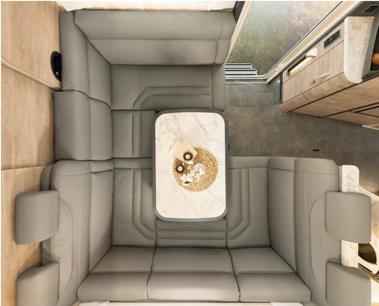
Här får alla plats! När genomgången till förarhytten är stängd bildas en rymlig rundsittgrupp med hjälp av en extra dyna • A 9000-2