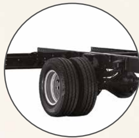
Bakhjulsdrivning med tvillingdäck och luftfjädring av drivaxeln