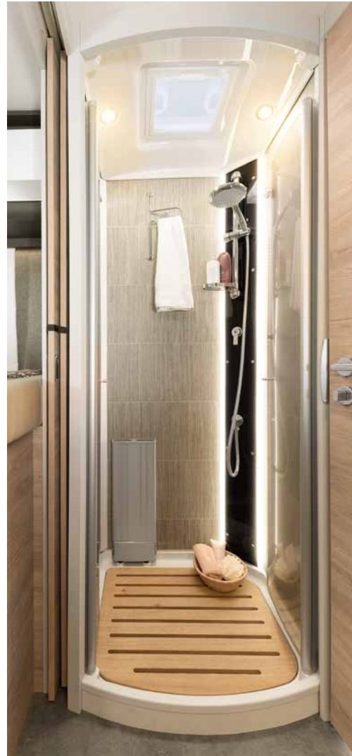
Stor duschkabin med plexiglasdörr, regndusch och stämningsbelysning