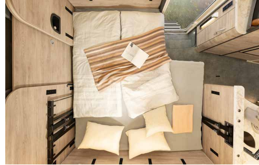
När ni behöver fler sovplatser kan en sittgrupp snabbt omvandlas till en säng för två personer