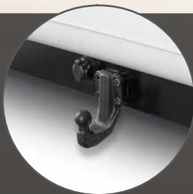
Släpvagnsvikt 3,5 t bromsad; draganordning (tilläggs- utrustning)