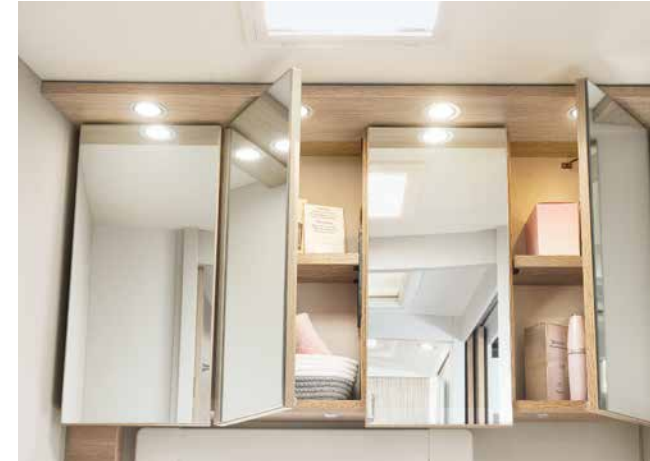
Stort spegelskåp precis som hemma