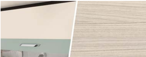
+ Trädekor Tindari Bora