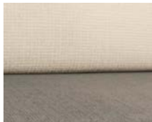
+ Klädsel Kapan