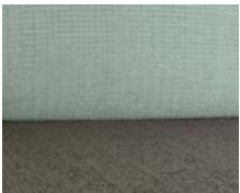
+ Klädsel Timor