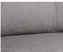
+ Klädsel Tarragona