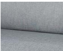
+ Klädsel Amposta