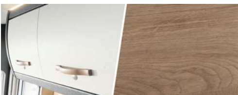
+ Trädekor Amberes Oak