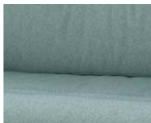
+ Klädsel Badalona