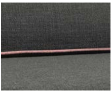
+ Klädsel Visby ○