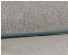
+ Klädsel Fyn