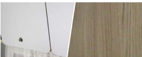
+ Trädekor Maryland Oak