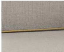
+ Klädsel Skagen ○