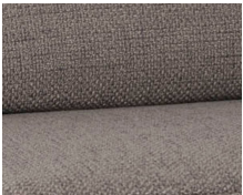
+ Klädsel Selma