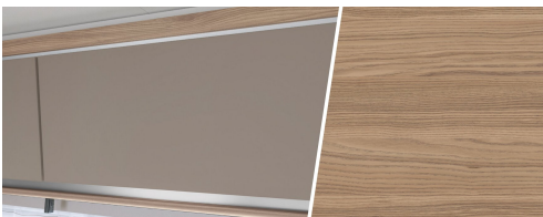
+ Trädekor Ashton