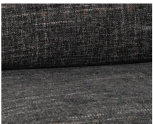
+ Klädsel Lona ○