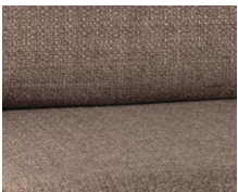
+ Klädsel Tarragona