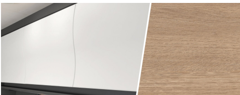
+ Trädekor Amberes Oak