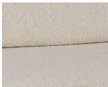
+ Klädsel Tropea ○