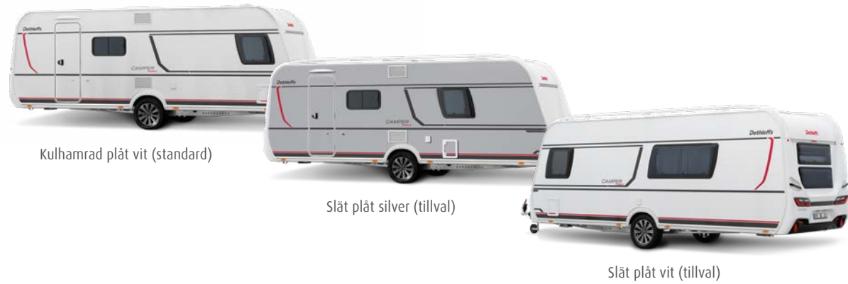
Kulhamrad plåt vit (standard)