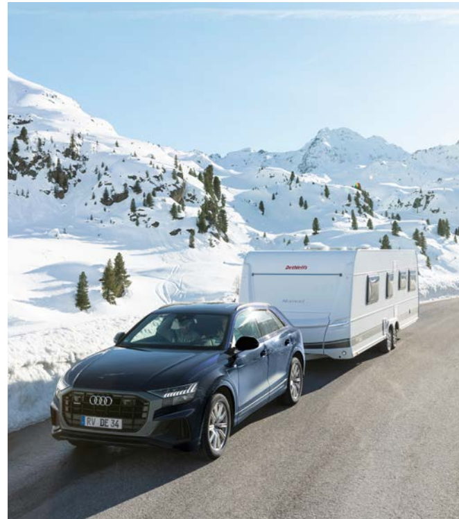
Känn dig säker under den kalla årstiden i en vinterbonad husvagn med vinterkomfortpaket som tillägsutrustning från Dethleffs.