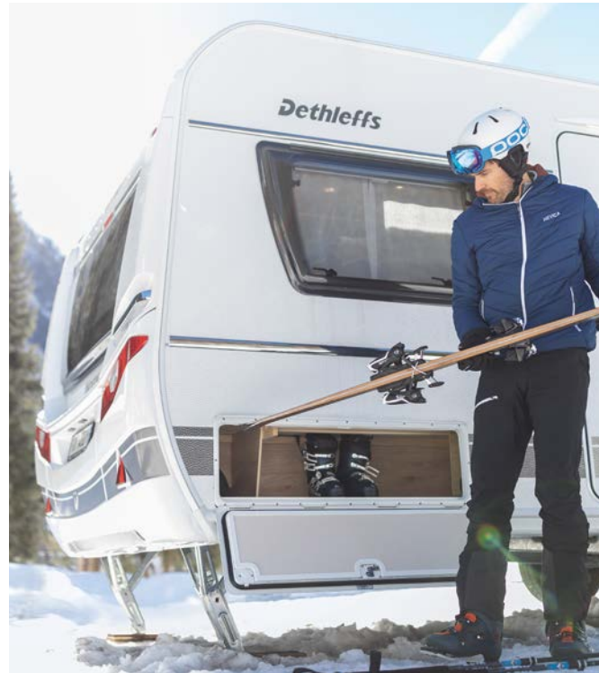
En semesterlägenhet precis intill skidbacken, inomhus är det lika härligt varmt som hemma.

Med den här utrustningen som baseras på mångårig erfarenhet förblir det varmt och skönt i husvagnen också under iskalla nätter och vattensystemet fryser inte.