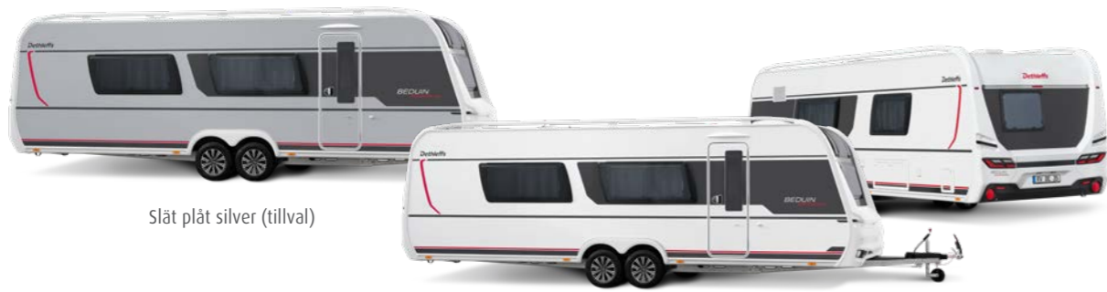
Slät plåt silver (tillval)