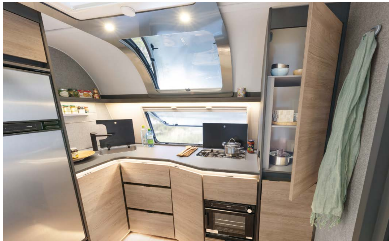
Frontköken i Beduin är helt enkelt fenomenala! Utrustning, arbetsyta, förvaring, rörelsefrihet – bättre går det inte. Och den stora fönsterfronten ger ljus, frisk luft och en härlig utsikt. • 690 BQT