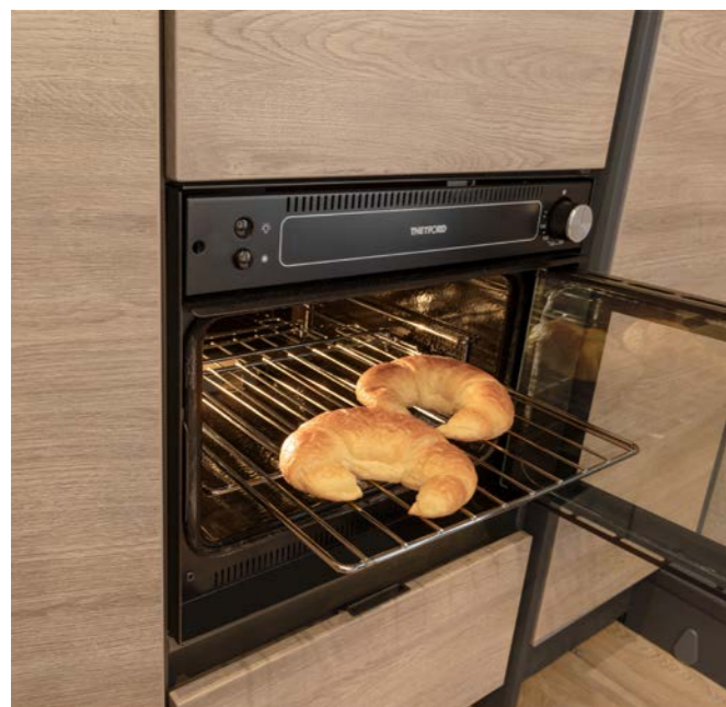
I ugnen (standard) kan man tillaga utsökt mat på semestern som söndagsfrallor, kakor eller pizza.