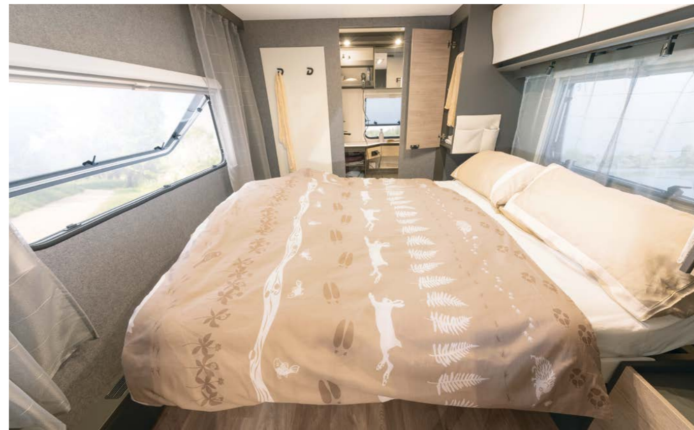
Det går att skjuta vår generösa queensbed på längden så att passagen till badrummen blir ännu bredare på dagen. Undertill döljer sig ett enormt förvaringsutrymme som även är åtkomligt utifrån. • 690 BQT