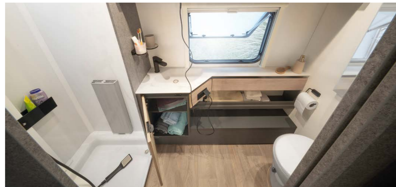
Vilken kvalitet på badrummet! Rörelsefrihet, en separat duschkabin, ett elegant, infällt tvättställ och ett fönster för ventilation! Bättre än så kan inte dagen börja! • 690 BQT