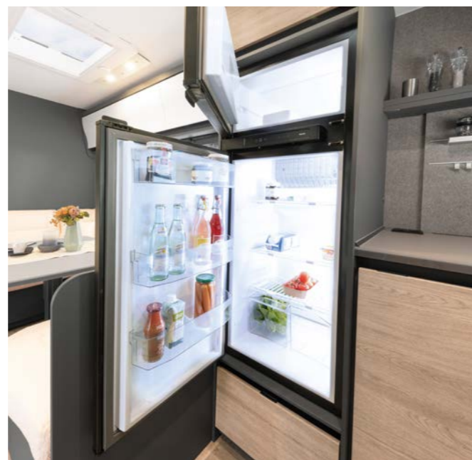
Här förblir allt färskt! Kyl-/frys-kombination på 137 resp. 156 l total volym (beroende på modell) och autom. energival AES.